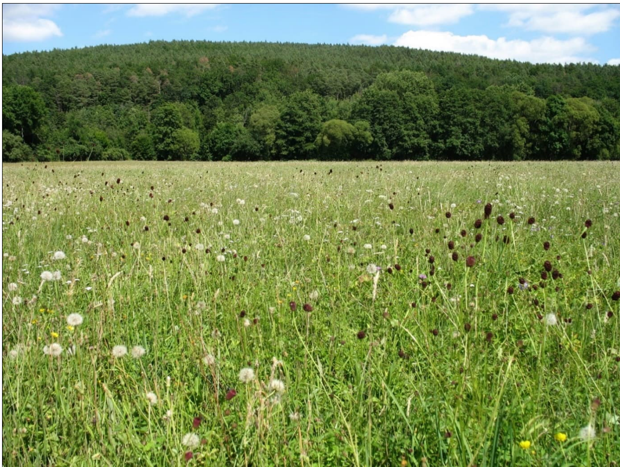
Magere Flachlandmähwiese (Lebensraumtyp 6510)