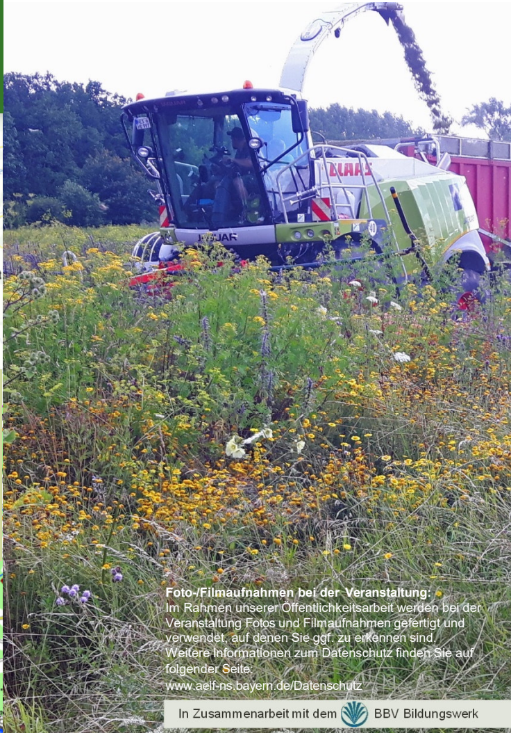
Foto-/Filmaufnahmen bei der Veranstaltung: Im Rahmen unserer Öffentlichkeitsarbeit werden bei der Veranstaltung Fotos und Filmaufnahmen gefertigt und verwendet, auf denen Sie ggf. zu erkennen sind. Weitere Informationen zum Datenschutz finden Sie auf folgender Seite: www.aelf-ns.bayern.de/Datenschutz

Der jeweilige Startort für die erste Besichtigung wird Ihnen dann mit einer Anfahrtsskizze zugesandt. Dort beginnt für Sie die Veranstaltung