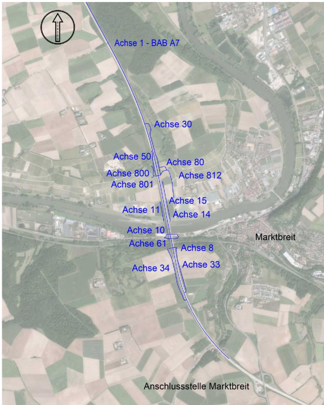
Anlage 1: Achsübersicht aller durch die Baumaßnahme berührten Straßen und Wege (einschl. Baustraßen)