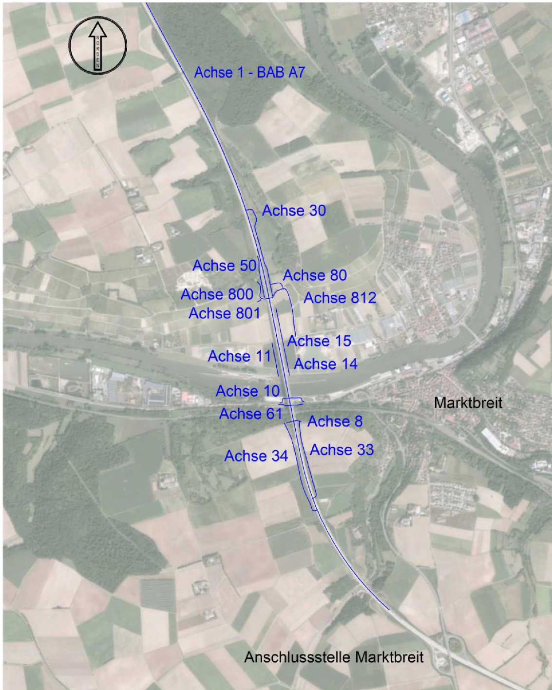
Anlage 1: Achsübersicht aller durch die Baumaßnahme berührten Straßen und Wege (einschl. Baustraßen)